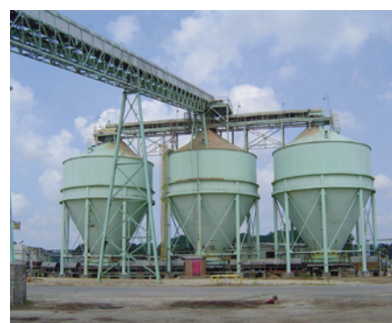
Figura 7. Antes de ser convertida en transmisiones dobles de 15 HP (una en cada extremo) la transmisión única en el transportador inversor situada encima de los depósitos de astillas de madera se resbalaba durante clima de invierno debido a la rigidez de la banda.