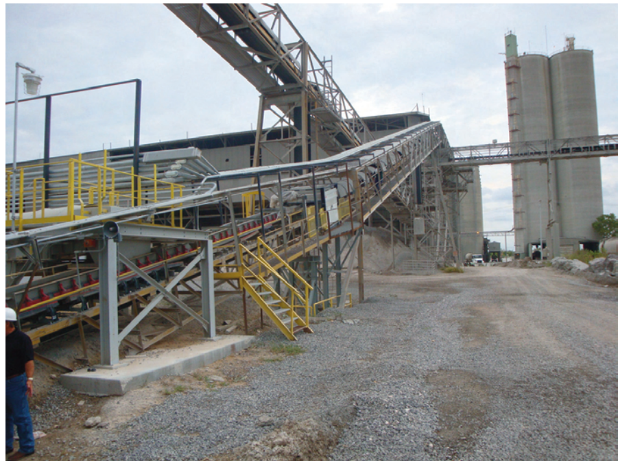
Figura 4. Antes de su modernización, el transportador de recuperación por túnel de 550 pies (167.6 metros) de largo, que eleva el material a 138 pies (42.1 metros) a 400 t/h, no arrancaba bajo carga plena.