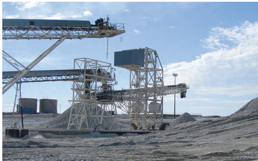
Figura 6. La apiladora radial interrumpía la producción de la mina debido al resbalamiento de la banda en la transmisión trasera de 100 HP y 30 años de antigüedad durante condiciones de lluvia