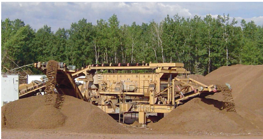
Figura 2. Vista general de la planta portátil de recirculación para trituración/cribado de 800 t/h que incorporó Poleas Motorizadas compactos dobles de 15 HP a fin de accionar un transportador alimentador de la criba.

No se necesitaron motores ni circuitos de control especiales. Ni esfuerzo para sincronizar las transmisiones. Se usaron motores de inducción de CA tipo jaula de ardilla de diseño en C normal. Si un motor intenta girar más rápido que el otro, consume una cantidad significativamente mayor de corriente.