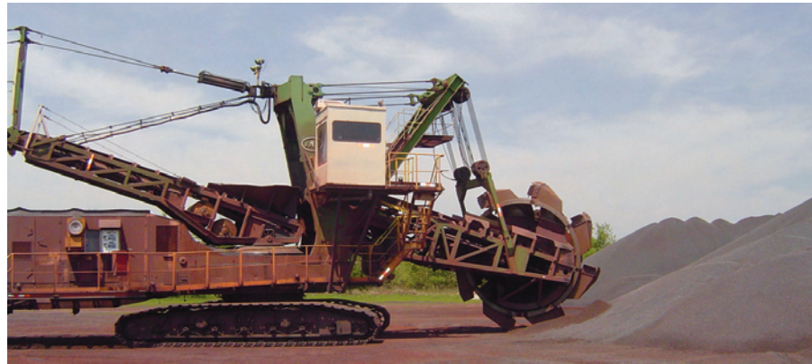
Figura 3. Uno de los tres elevadores a cangilones de 4,000 t/h con antigüedad de 40 años modernizados por BNSF con tres Poleas Motorizadas (uno en la pluma y el otro en la parte trasera).

Buzzi reemplazó la transmisión delantera de 75 HP por dos Poleas Motorizadas modelo 630H, cada uno de 50 HP, en las posiciones delantera y trasera. El sistema de transmisión doble ofrecía más potencia y permitía 360 grados de arrollamiento de la banda