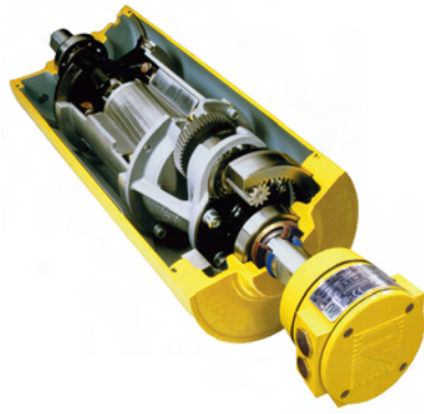
Figura 1. El Polea Motorizada sella el motor y la caja de engranajes dentro de una carcasa de tambor llena de aceite.

evidente la ventaja del sistema de transmisión, especialmente cuando se utiliza en vetas de carbón de 42 pulgadas (106.7 cm).